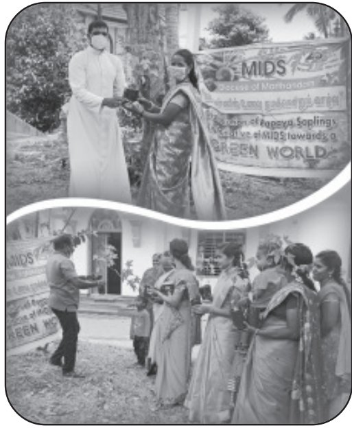
10.09.2021 அன்று மறைமாவட்ட ஜூபிலியை முன்னிட்டு விமலபுரம் பங்கில் உள்ள 150 குடும்பங்களுக்கு 300 பப்பாளி மரக் கன்றுகள் வழங்கப்பட்டன.